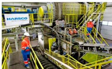
Varnost je ena od temeljnih vrednot Harsco Minerals. Zapisana je v DNK vseh zaposlenih.

Ob prihodu na dvorišče podjetja, kjer so vsi zaposleni in obiskovalci vozila zaradi varnosti parkirali vzvratno, nam je takoj postalo jasno, da tu nespoštovanje pravil ne pride v poštev. Kot primer dobre prakse smo obiskali podjetje Harsco Minerals, ki se ukvarja s predelavo žilindre.