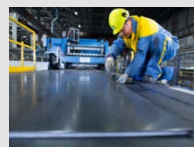
Kakovostni izdelki zahtevajo kakovostno orodje – industrijske nože iz Ravne Systems.