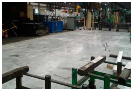
»Parkirišče« za novo pridobitev – brusilni stroj.