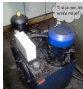
Primer slabo vzdrževanega elektromotorja.

Preventivno vzdrževanje je edina prava smernica za prihodnost in v današnjem času in vseh ravneh končno dobiva pomen, ki mu pripada.