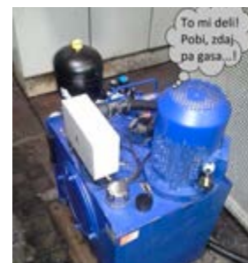
Isti motor kot na prejšnji sliki – le da je zdaj dobro vzdrževan.

Vsako preventivno vzdrževanje stroja se začne z delom njegovega »prvega lastnika«, to je njegovega operaterja. Ta je prvi, ki lahko s svojim vestnim delom podaljša življenjsko dobo stroja ali prepreči njegove večje poškodbe.