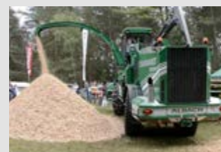
Mobilni sekiro stroj Albach – Diamant 2000