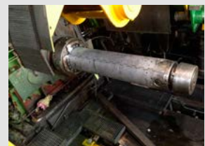
Postavljen navijalec z novimi segmenti in gredjo tik pred vgradnjo zadnjega pokrova.