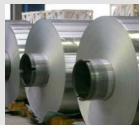
Aluminijevo folijo valjajo z našimi valji.