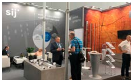
Pestro sejmsko dogajanje na Ligni 2017.

Blagovna znamka Ravne Knives se je konec maja uspešno predstavila na mednarodnem sejmu strojev in opreme za gozdarsko in lesnopredelovalno industrijo v Hannoveru.