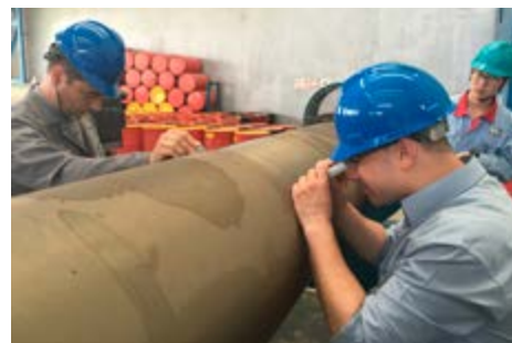
Preverjanje razpoke na valju pod nadzorom naročnika.

Na koncu odprave je vse slabe dogodke izničil prijeten občutek, ko smo reklamacije s strokovno razlago in