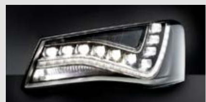
Žaromet z izključno LED-svetlobnimi izvori s funkcijami AFS.